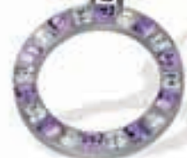
Anhänger mit Kette €69,-